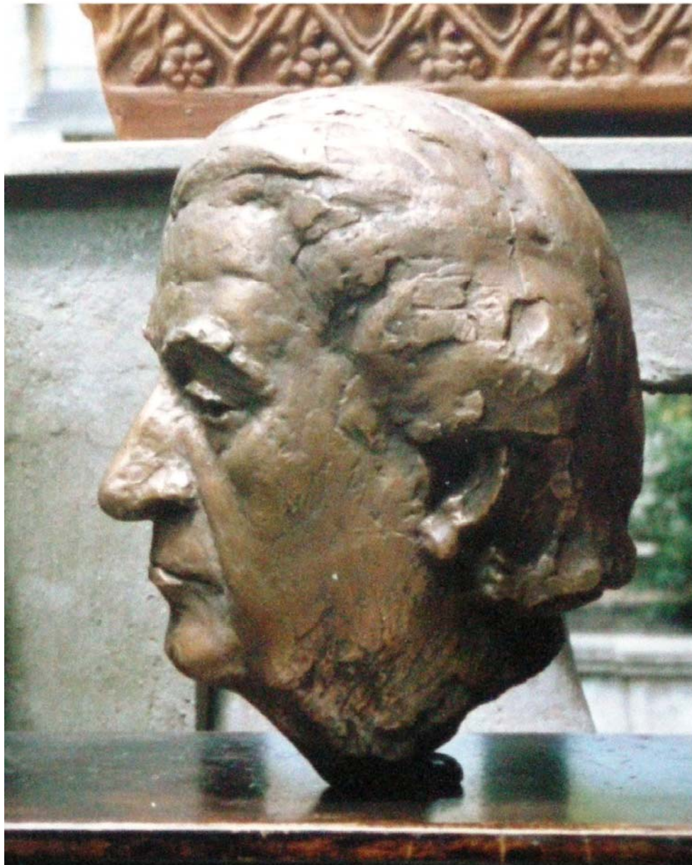
P015j, S. CELIBIDACHE, 34x26x27, bronzo, ca.1987.